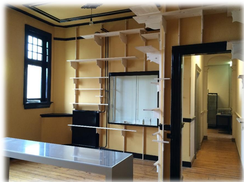
Impressie proefzaal 1ste verdieping