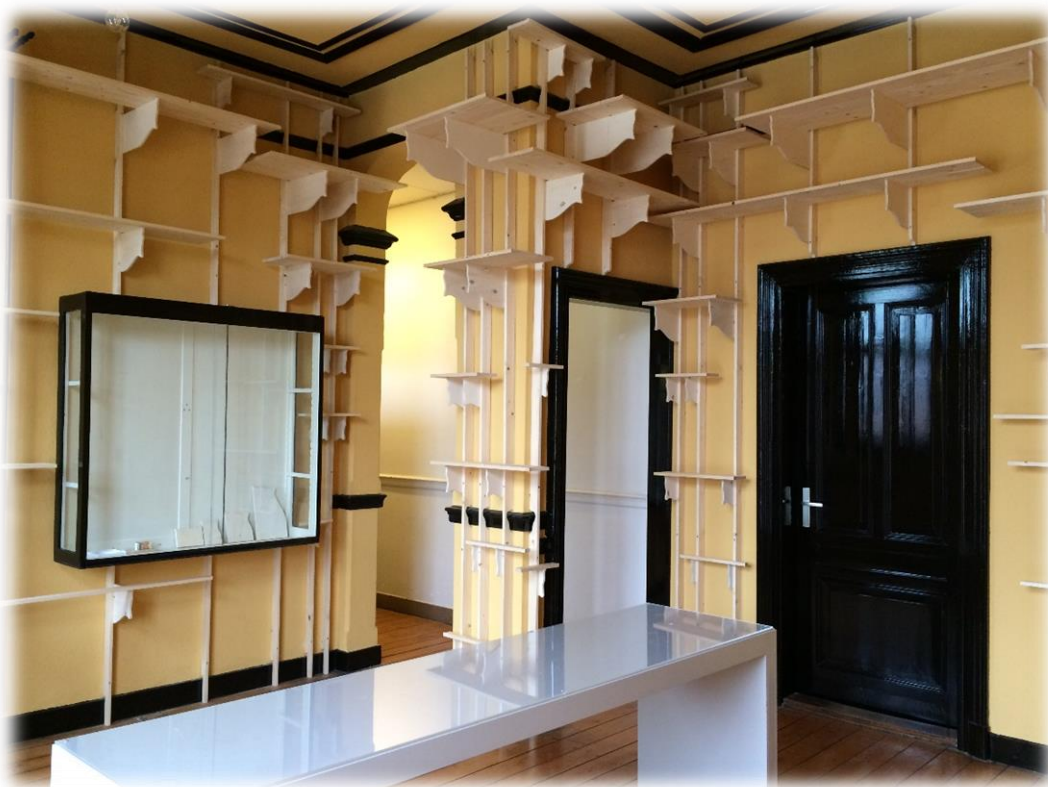
Impressie proefzaal 1ste verdieping

Fase 5: Promotie (sept 2017 – dec 2017) - NB. promotie van ontwikkelingen zal gedurende hele project Plaatsvinden